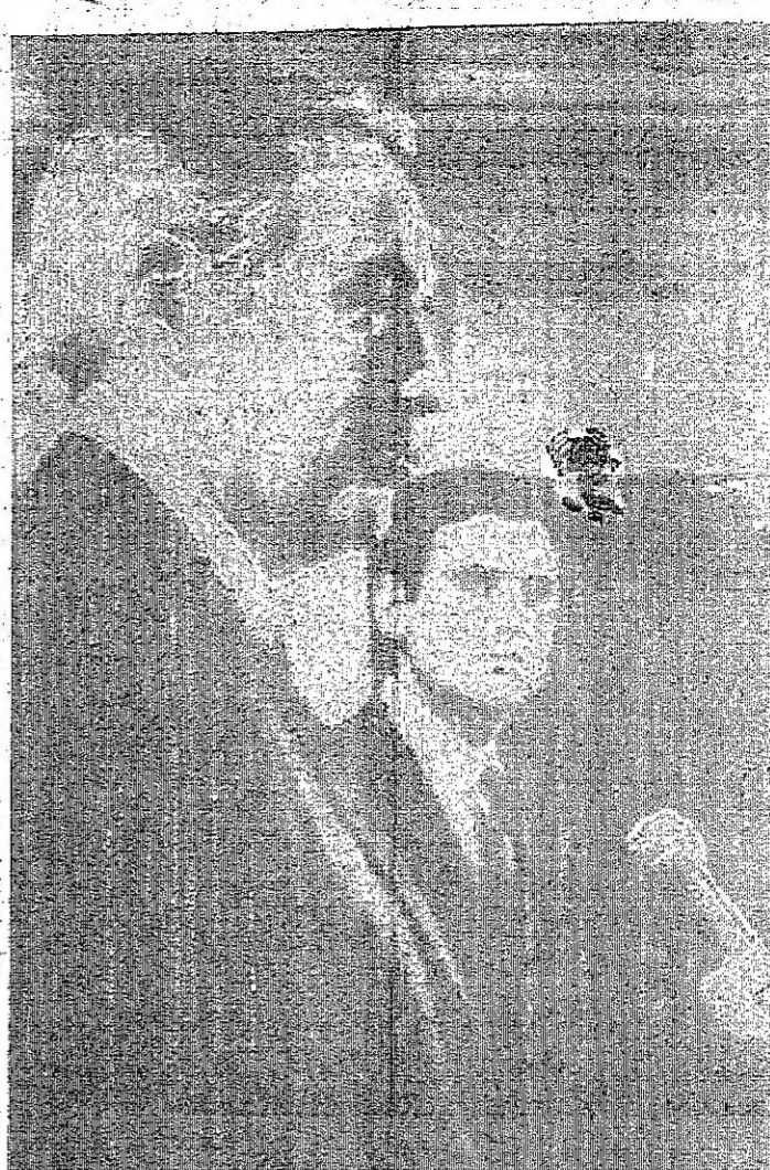
المستر وليام سكرانتون حاكم بنسلفانيا...